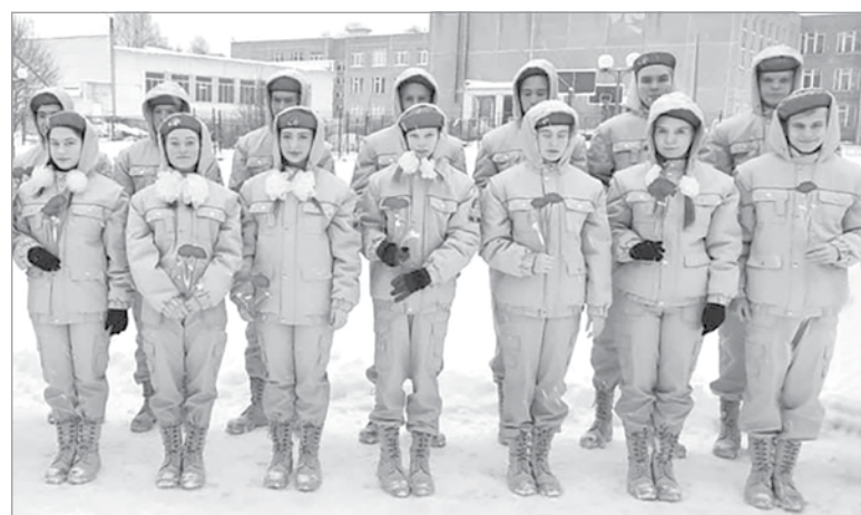
Юнармейцы городской школы № 2 – участники патриотических мероприятий