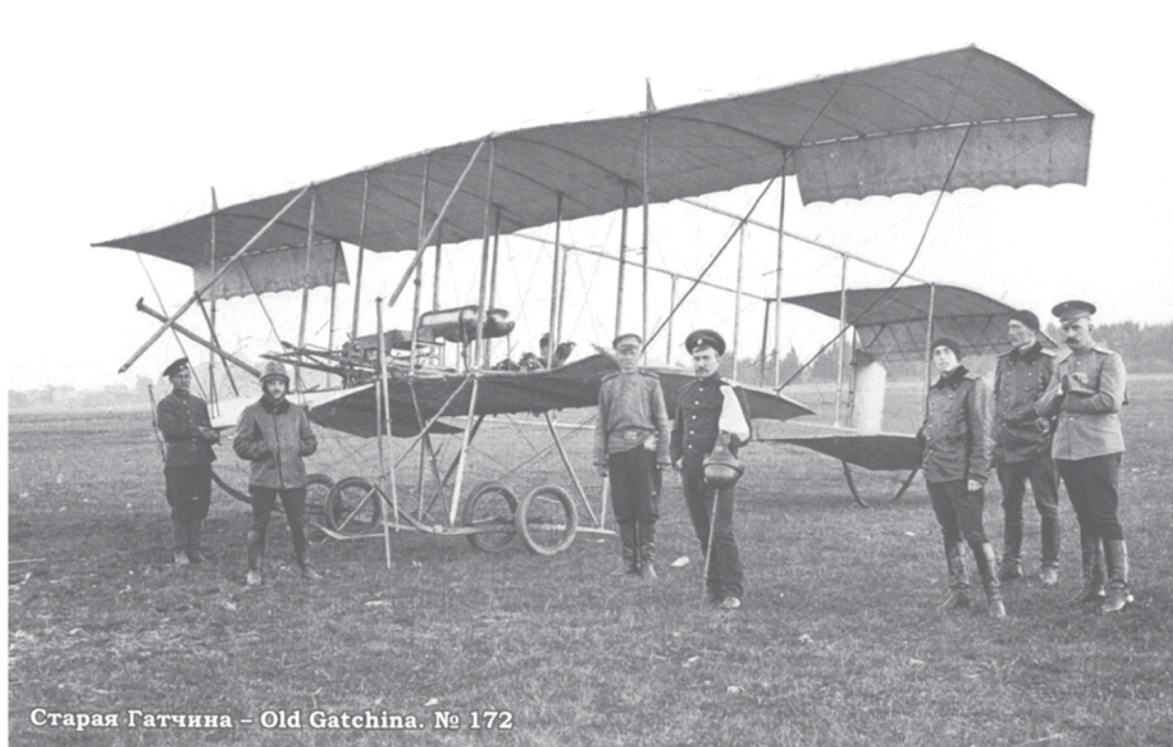
Старая Гатчина – Old Gatchina. № 172