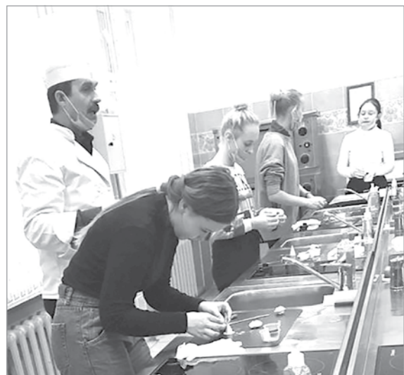
Профессиональные пробы по профессиям повар, кондитер и водитель