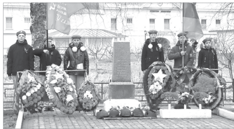
Торжественный митинг в д. Старая Слобода