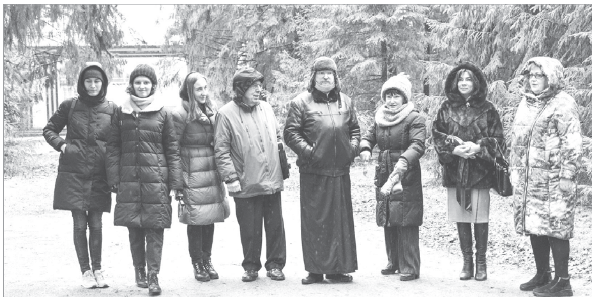
Члены Общественной палаты Ленобласти сначала побывали в парке и в музее

О том, что парку необходимо вернуть первоначальный облик за исключением части ангаров с военной