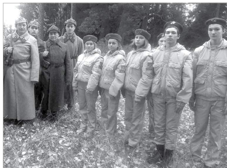
Торжественно-траурная церемония в п. Свирьстрой