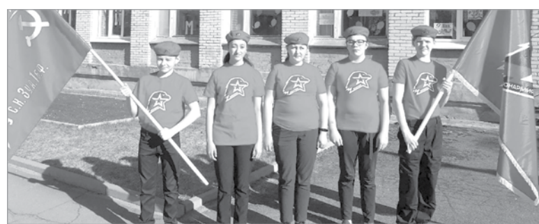
Акция юнармейцев Алеховщинской школы