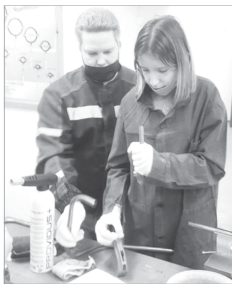
Наставники помогли ребятам сделать первые шаги в профессиях мастер ЖКХ и электромонтёр

Профессиональная проба по профессии «Повар, кондитер» направлена на формирование интереса к этой профессии, способствует саморазвитию и самоопределе-