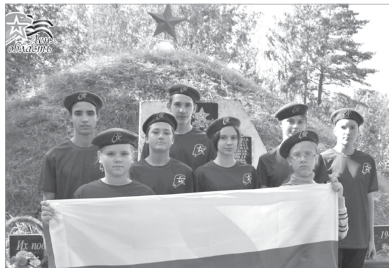
Юнармейцы отряда «Патриот» Рассветовской школы

Светлана МИХАЙЛОВА